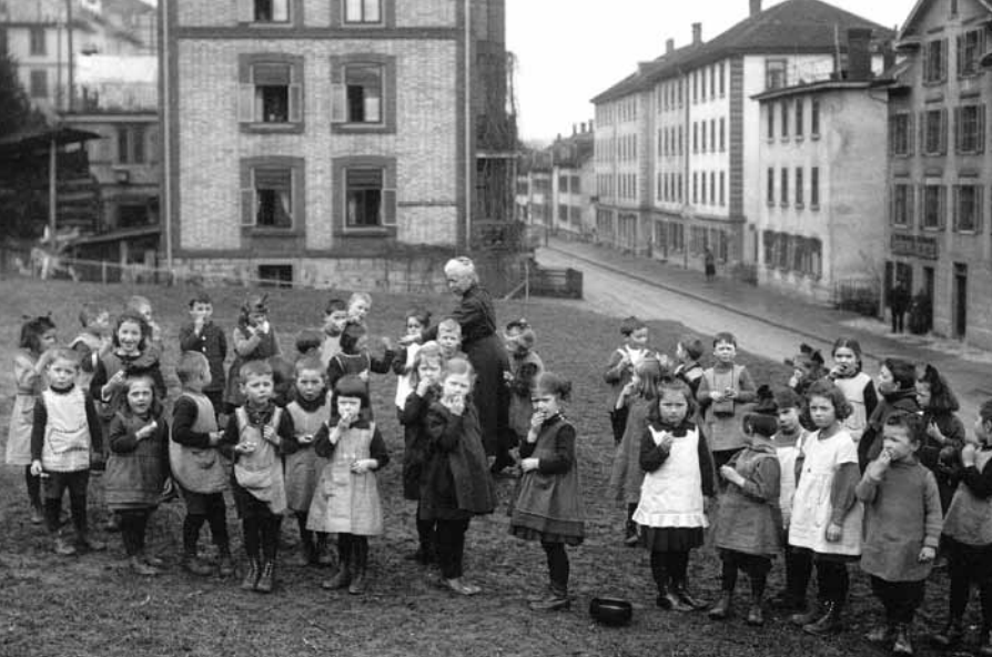
St.Galler Kinder- gärtler im Arbeiter- quartier Tschudi- strasse.

frage. Loepte-Benz, als Zeitungsverleger in Rorschach erfolgreich bestreikt, wettete gegen die «Volksstimme», die als einzige Zeitung während den Streiktagen erscheinen konnte. Das Blatt habe «falsche Nachrichten» verbreitet.