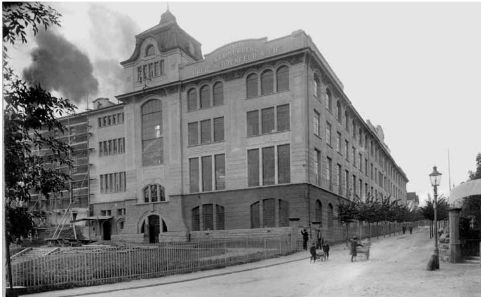
Textilbetrieb der Feldmühle AG, Rorschach.

50seitigen Bericht ab. Anhand dieses Dokuments lässt sich der Verlauf der Protestaktionen auf der Strasse zum grossen Teil rekonstruieren. Mehreren Betrieben stattete der Streikzug einen ungebetenen Besuch ab, natürlich auch der Feldmühle, Rorschachs bedeutendster Industrieanlage. Die Feldmühle wurde später, im Jahr 1946, Schauplatz eines legendären Streiks.