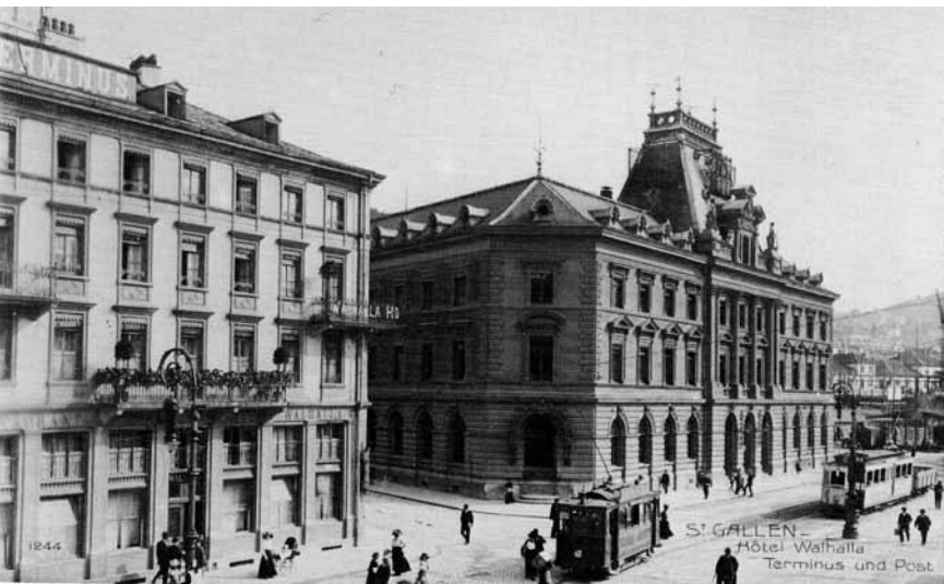
St. Galler Bahnhofplatz um die Jahrhundertwende mit Hotel Walhalla-Terminus und Post.

lung der Tramfahrten angeordnet. Neben den Arbeitern der öffentlichen Verkehrsmittel befolgten auch jene des Druckereigewerbes den Streik weitgehend, so dass die bürgerliche Presse nicht erscheinen konnte.