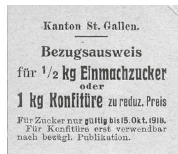
St.Galler Lebens- mittelmarke, Oktober 1918.

Um möglichst vielen EinwohnerInnen trotz Teuerung den Kauf jener Mengen an Lebensmitteln zu ermöglichen, die ihnen gemäss Rationierung zustanden, gab der St.Galler Stadtrat den Haushaltungen, deren Einkommen eine gewisse Grenze nicht überstieg, Grundnahrungsmittel zu billigeren als den marktüblichen Preisen ab. Ende 1918 war nicht weniger als ein Drittel der städtischen Einwohnerschaft, rund 23'000 Menschen, zum Bezug verbilligter Produkte berechtigt. Auf noch preiswertere Art konnte man sich in den von der Stadt unterhaltenen Suppenküchen verköstigen, einer Institution, die gegen Jahresende 1918 fünf Koch- und 15 Abgabestellen betrieb und bis zu 5000 Liter Suppe im Tag herstellte.