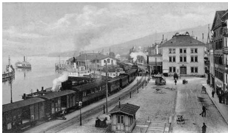
Rorschacher Hafens- bahnhof um die Jahrhundertwende.

Am Dienstag, 12. November 1918, trumpften nun die Arbeiter auf. Anders als in vielen Orten der Provinz, wo gar nicht oder nur wenig gestreikt wurde, begaben sich hier die Arbeiter in Massen auf die Strasse und setzten sich damit als für alle sichtbarer neuer Machtfaktor öffentlich in Szene. Es blieb aber nicht nur bei einer Kundgebung. Die Streikenden nahmen das Heft in die Hand und wollten ihre Arbeitsniederlegung in der ganzen Stadt durchsetzen. Sie zogen von Betrieb zu Betrieb und zwangen die Arbeitgeber, die Produktion einzustellen. Ihnen kam dabei der Umstand entgegen, dass es kein grosses Militäraufgebot gab. Dies im Unterschied zu St.Gallen, das militärisch regelrecht besetzt war. Deshalb hatte die dortige Streikleitung aus Angst vor Provokationen auf