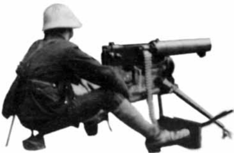
Armeeposten gegen Streikende, Zürich, 1918

sche und soziale Ereignis dieses Jahrhunderts. Die folgenden Texte versuchen, die politische Erinnerung an den November 1918 wachzuhalten oder aufzufrischen und den ‚Grosskampf‘, wie ihn Ernst Nobs genannt hat, jenseits von Nostalgie und Heldenverehrung in aktuelle Zusammenhänge zu stellen.