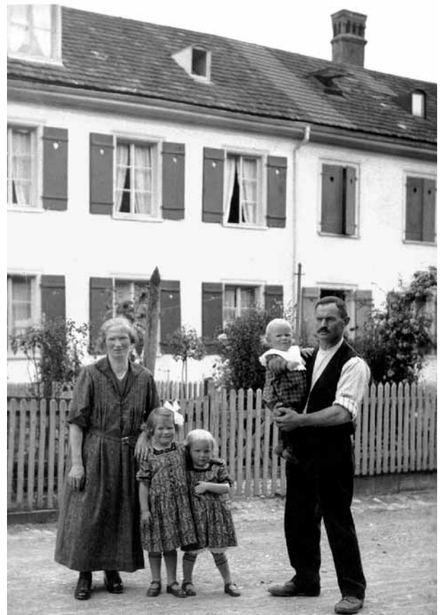
Arbeiterfamilie in St.Gallen.

Dass die Christlichsozialen den Generalstreik ablehnten, lässt sich also aus der Bewegungsprogrammatik sowie aus der starken Bindung an das katholische Lager erklären. Doch es bleibt die Tatsache, dass die christlichsoziale Bewegung bei der wichtigsten und massivsten Demonstration der schweizerischen Arbeiterschaft im 20. Jahrhundert abseits stand – einer Aktion, die wie keine andere das Bewusstsein reifen liess, dass Arbeiterinteressen in den innenpolitischen Auseinandersetzungen nicht einfach mehr übergangen werden konnten. Aus dieser Optik betrachtet hat das christlichsoziale Abseitsstehen im November 1918 durchaus eine schmerzliche Seite.