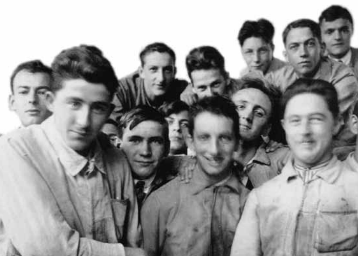
Arbeiter bei Brown- Boveri, Baden, 1923

Die Erinnerung an die Geschichte ist nicht einfach rückwärtsgewandt. Sie zeigt, wie sich die Verhältnisse verändert haben, und lässt damit erahnen, wie sie sich verändern könnten. Die Beschäftigung mit der Geschichte befreit uns davor, vor den vermeintlich übermächtigen Bedingungen der Gegenwart zu erstarren. Und mindestens etwas lehrt der Blick zurück ganz konkret: Für sich allein bringen einzelne nicht viel zustande. Gemeinsam sind aber auch die vermeintlich Machtlosen eine Macht.