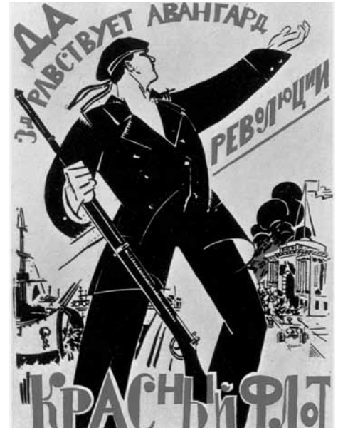
«Aufgesessen, Arbeiter!» Anonymes Plakat, Sowjetunion, 1919

Teil einer Welle der Weltrevolution oder schwaches Echo auf eine letztlich gescheiterte welthistorische Hoffnung – der Landesstreik von 1918 mit seinen neun prägnanten Forderungen bleibt für die Schweiz das herausragende politi-