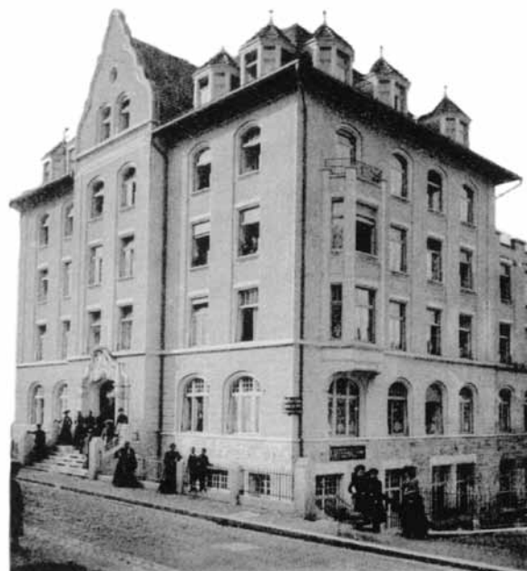
Das Marthaheim, ein Arbeiterinnen- und Mädchenheim an der St.Galler Unterstrasse.

X Murg. Im Kanton St.Gallen entbrannte der letzte Streik 1988 in der Spinnerei Murg. Eine Woche lang wehrten sich die zumeist ausländischen ArbeiterInnen zusammen mit der Gewerkschaft Textil Chemie Papier gegen eine Ausweitung der Schichtpläne. Die Betriebsleitung musste zum Teil zurückkriechen. Sie kam mit dem Versuch, die Arbeitszeit vollständig zu deregulieren, nicht durch. Die Spinnerei wurde im Sommer 1997 von der Besitzerfamilie von Ziegler abrupt geschlossen – ein klassisches Beispiel des «shareholder value».