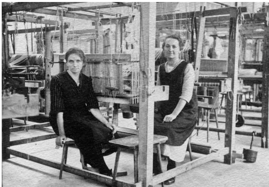
Weberinnen aus dem Zürcher Oberland, um 1920.

X Mehrbelastung. In der Wirtschaftskrise tragen die Frauen durch Stellenverlust und Familienarbeit immer noch die Hauptlast. Trotz verfassungsmässiger Gleichstellung liegen die Frauenlöhne in der Privatwirtschaft gemäss der letzten Lohnstrukturerhebung des Bundesamtes für Statistik 1996 im Schnitt um fast 30% tiefer als jene der Männer. In keiner einzigen Branche verdienen die Frauen mehr als die Männer. Dort, wo Tiefelöhne gezahlt werden, im Detailhandel, Gastgewerbe und in der Bekleidungsindustrie, sind die Frauen übervertreten.