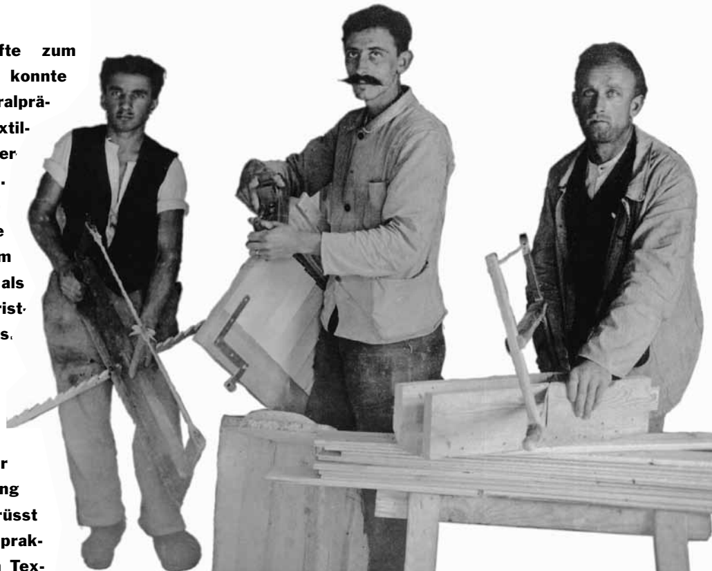
Schreiner gesellen, um 1915.

tionismus. Mit abnehmender Bedeutung der religiösen Milieus und der ideologischen Ausrichtungen rücken heute die christlichen und die SGB-Gewerkschaften näher zueinander. Im Kanton St.Gallen arbeiten der Gewerkschaftsbund, die Christliche Gewerkschaftsvereinigung und die Angestelltenverbände schon länger zusammen. Die Kooperation begann mit der Initiative «Solidarität in der Krise» 1994 und setzte sich seither bei verschiedenen Kundgebungen gegen den Sozialabbau und politischen Vorstössen fort.