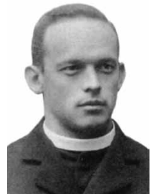
Alois Scheiwiler, 1907, christlichsozialer Arbeitersekretär, später Bischof von St.Gallen.