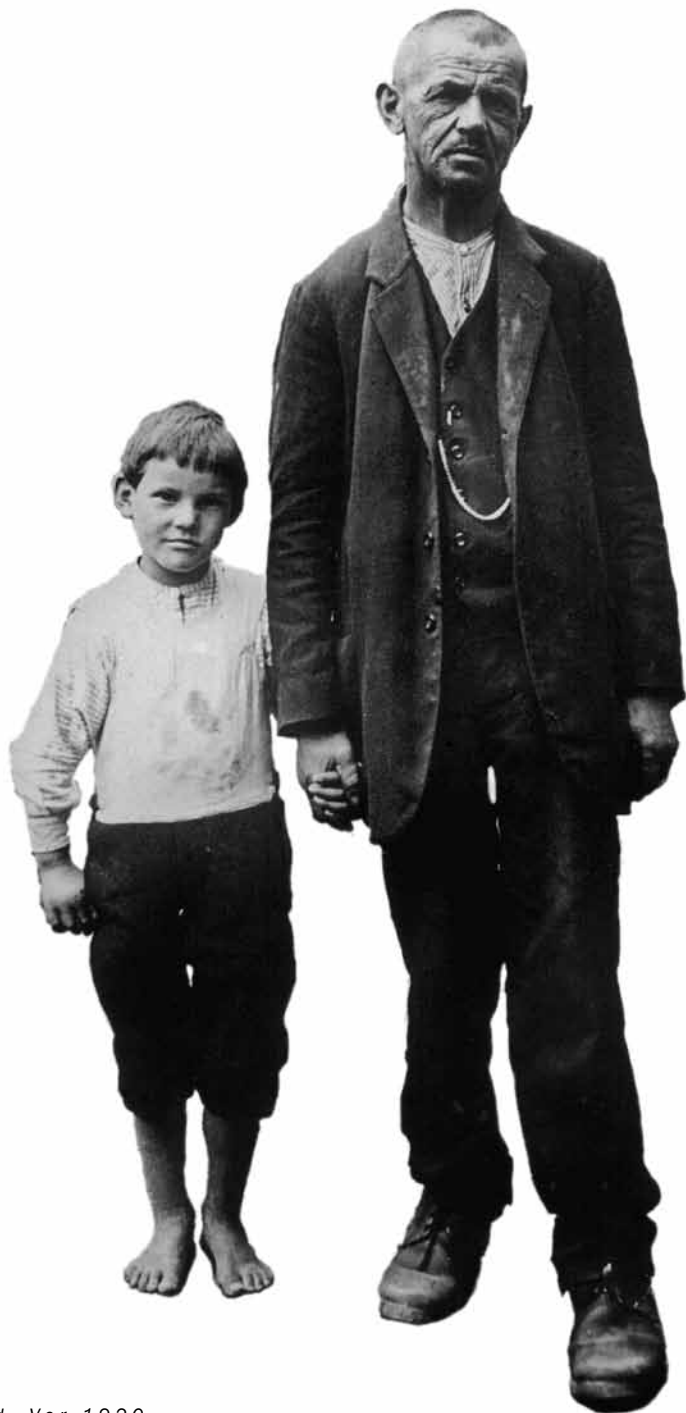
Fabrikarbeiter mit Kind. Vor 1920.