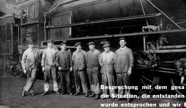
Heizer im Lok-Depot Basel, 1925.

Besprechung mit dem gesamten Streikpersonal forderte im Hinblick auf die Situation, die entstanden durch die 15 Umgefallenen. Diesem Verlangen wurde entsprochen und wir Engesperrten trotteten diesmal ohne Ehrengelichte, aber schweren Herzens, wir wären lieber im Arrest geblieben, nach dem Bahnhof, wo im Kondukteurzimmer die Beratung stattfand.