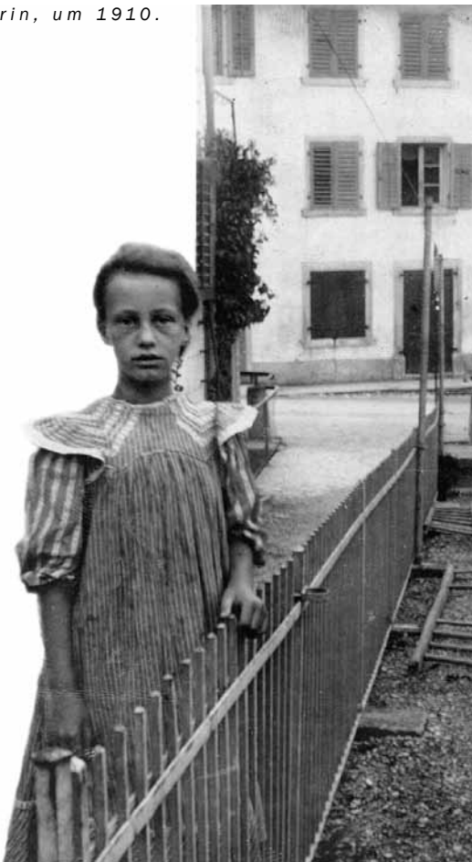
Jugendliche Fabrik- arbeiterin, um 1910.

Zwar hatte Angelica Balabanoffs Aufklärung eine Skandalisierung dieser Verhältnisse zur Folge. Doch brachte erst die Textilkrise die inkriminierten Heime zum Verschwinden. Die blitzgescheite Russin blieb aber für die Bürgerlichen ein rotes Tuch. Der drohende Generalstreik bot ihnen dann später die günstige Gelegenheit, sich dieser unbequemen Kritikerin zu entledigen. Für die Behauptung, sie wolle in der Schweiz ein «revolutionäres Hauptquartier» errichten, fehlte jedoch jeder Beweis. Angelica Balabanoff selber wies diesen Vorwurf stets zurück. Sie ging anschliessend in die Sowjetunion, wandte sich dann aber von Lenin ab, dessen reine Machtpolitik sie enttäuschte. Doch sie blieb bis ans Ende ihres Lebens überzeugte Marxistin. 1965 starb sie neunzigjährig in Rom.