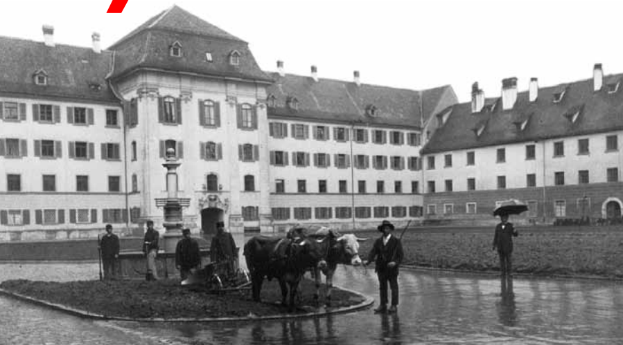
Kartoffelacker auf dem Klosterplatz St. Gallen, 1918.

Die Lebenshaltungskosten wurden während des Krieges für viele Familien unerträglich hoch, weil die Väter als Soldaten über Monate Militärdienst leisten mussten und ihre Arbeitgeber nicht verpflichtet waren, ihnen in dieser Zeit den Lohn auszuzahlen. Eine obligatorische Verdienstausfallentschädigung gab es nicht, und der Tagessold der Soldaten belief sich auf lediglich 80 Rappen, wofür man bei Kriegsende